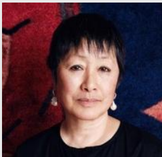
Billie Tsien 建筑师